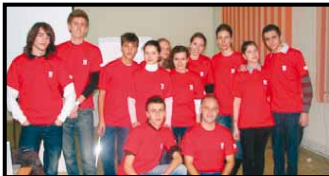
Activități ale voluntarilor YouthBank Constanța